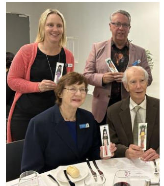
しおり人形を手にする皆さん